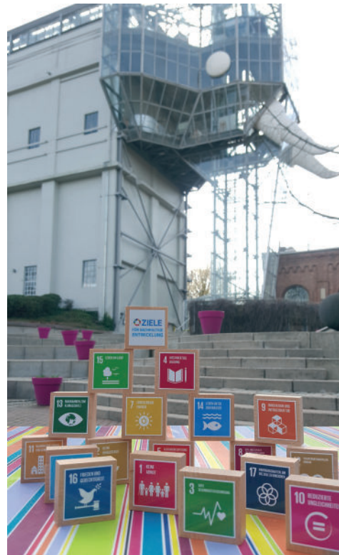
Fotos: Maximilianpark Hamm, Bundesregierung (Titel), Éditions Callicéphale, Straßburg, forum-kamishibai.de (Il faudra Abbildung und Text)